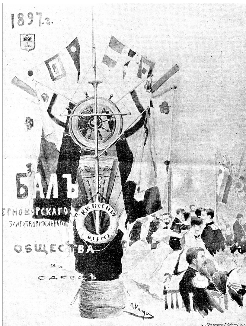
Одесса. — Баль Черноморскаго благотворительнаго общества 22 Ноября 1897 г.