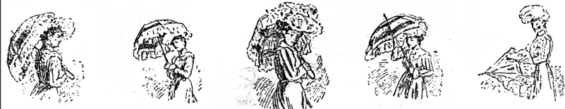
"Отвергнуть". "Можно". "Благосклонна". "Любопытна". "Жду".

Женщины издавна неустанно изобрѣтали новые способы дѣлиться мыслями, не прибѣгая ни къ письму, ни къ разговору. Этимъ-то путемъ и произошли языки — вѣера, почтовыхъ марокъ, цвѣтовъ... Теперь американки нашли подобное назначѣнїе и для зонтика: — конечно, не для такого, какимъ защищаются отъ дождя и солнца простые смертные. "Филологическїй" зонтикъ — верхъ изящества: вызолоченный, покрытъ отличнѣйшимъ шелкомъ, тюлемъ и кружевами. Наши рисунки даютъ понятїе о своеобразномъ языкѣ зонтика.