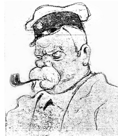
г. Ляровъ (Шамраевъ "Чайка") Шарж С. Ф.