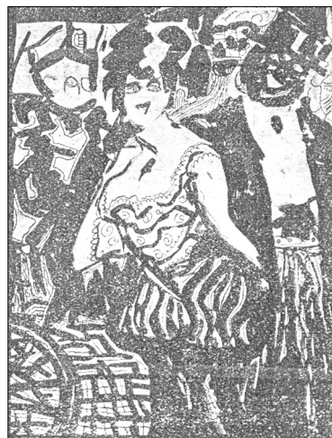
Ночное кафѣ. Рис. И. Мексина