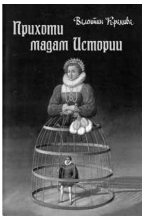
Валентин КРАПИВА Прихоти мадам Истории Одесская городская типография, 2010

Трамвай плывет между звездами. Спектакли, концерты — каждый день. Иногда этот трамвай опускается на землю. В декабре прошлого года он дважды побывал в Одессе. В начале месяца, пригнув голову, в вагон вошел смеющийся Крупник. Рассказал последний одесский анекдот. Через двадцать дней к ним присоединилась царственная Сатосова. Но это совсем другая история".