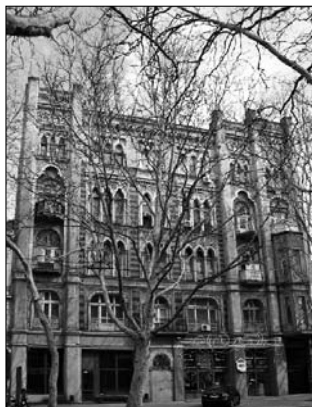
Дом Нолле, построен в 1901 г. Архитектор Е.Н. Смидович

Давайте пройдемся по улице Ришельевской, полюбуемся пышными формами венского барокко и взглянем в скромные фасады самых старых