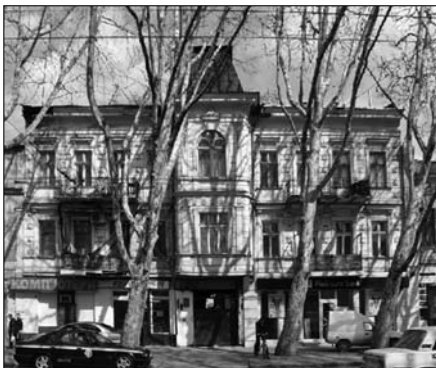
Ришельевская, 55. Доходный дом Поповича 1891 г. Архитектор Ю.И. Серадский

и женским болезням, принимает больных по адресу Ришельевская, 42.