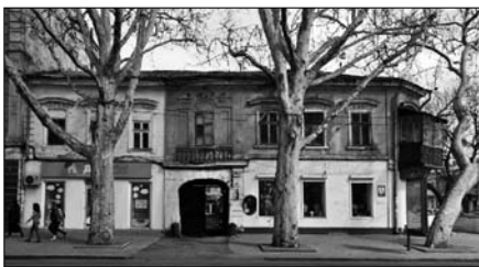
Ришельевская, 41 Этот старый дом охотно рисовали художники

Ришельевской, — это мир, создаваемый личностью, человеком, берущим на себя ответственность за свое дело.