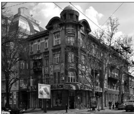
Ришельевская, 31 Доходный дом Одесского караимского общества 1913 г. Архитектор А.С. Пампулов