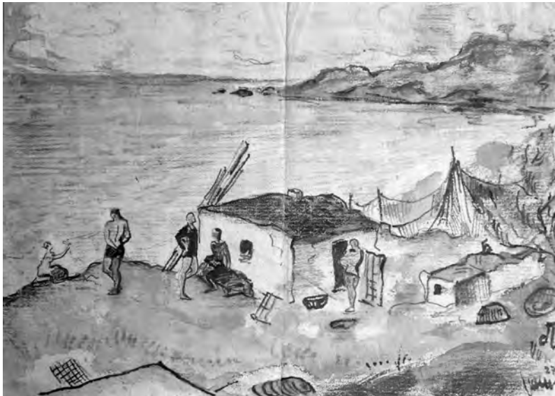
Одесса, 1927 г.