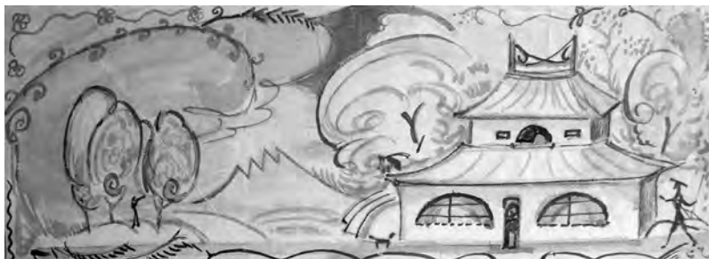
Одесса, 1928 г. Восточная фантазия