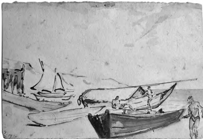
Одесса, 1926 г. Рыбачьи лодки

и Нежинской, я вернулся из университета, где должна была быть в этот день третья гимназическая сходка. Я был на первых двух, чтобы составить себе верный взгляд, и посмеялся хорошо. Что ж, порывы и идеи очень хороши у всех этих, очень искренние и возвышенны, но как они мало развиты! О, они, конечно, знают Маркса, Энгельса, всю историю развития социализма, некоторым из них нетрудно разобраться во всем, что касается социологии и политической экономии (и только!), хотя много, очень много толпы. Но что ж дальше? Говорят много речей, красивых и безобразных, неумных и неглупых, но все вертится на одном: «Долой самодержавие!», «Свобода, свобода», а между тем сами они плохо, неясно понимают свободу, они думают только о свободе чисто материальной, не понимая, что есть другая, другая истинная высшая красота и метафизическая свобода. Ну, и так при мне начали на Дерибасовской разносить оружейный магазин; полиции – никого, странно; долго-долго ломались, наконец влезли, все разнесли, разбежались (конечно, я не участвовал во всех этих приключениях, я оставался зрителем, смотрел в бинокль); тогда явились