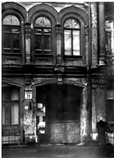
Одесса. Фасад дома на ул. Свердлова, 28

стоит в Одессе очень остро. На лето съезжаются на купания, и приезжие, естественно, могут платить гораздо дороже нас. С большим трудом достал себе комнатуху – клетушку за 10 руб. в месяц и то хорошо, так как въездных платить не надо. Правда, хозяева – мелкобуржуазный мещанский элемент, но я постараюсь с ними иметь поменьше дела, тем более, что летом я редко когда бываю дома. Притом комната почти без мебели – без стола, одна железная кровать без матраца, 2 стула и умывальник! На Пироговской, конечно, было значительно лучше, и воздух там прекрасный, здесь же –