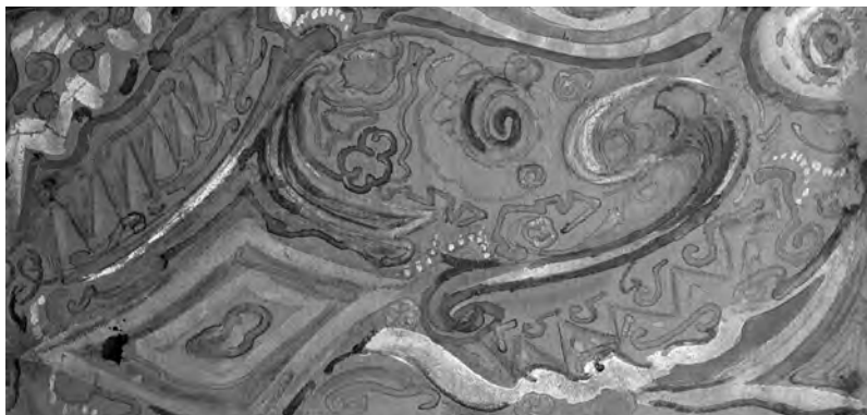
Одесса, 1929 г. Орнамент