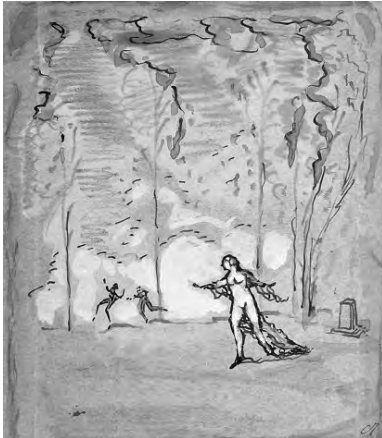
Одесса, 1926 г. В парке