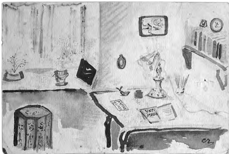
Одесса, 1929. Комната художника на ул. Свердлова, 28 (б. Канатная)

заж), на окне чахлые папоротники. На столе пепельница с колибри (Константинополь) и турецкий табурет. На окне портфель. Подставка для электрической лампочки – старый папин фарфоровый персидский подсвечник. На столе: перья, карандаши, украинские книги и Wlinsi .