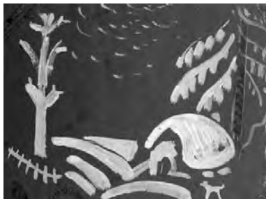
Одесса, 1925 г. В сугробах

тарена хотя я и читал, но с удовольствием перечитаю снова, а Tartarin-port не читал еще. Слышал, что очень модный новый роман какой-то писательницы – « Les deux baisers », кажется. Если случится в дешевом издании – пришли, пожалуйста, при случае. Я написал несколько новых стихотворений, но легко-го шуточного содержания – скорее