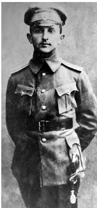
С.С. Чахотин. 1910-е годы

Изучая историю литературы в Одессе, мы с каждым годом находим новые, забытые имена литераторов Серебряного века, ставших жертвами террора в годы советской власти.