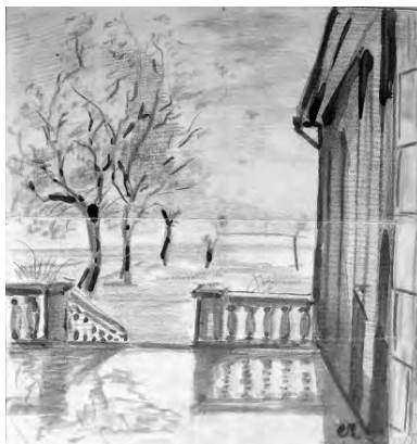
Одесса, 1924 г. 4-я станция Большого Фонтана, возле кадетского училища

которые продолжаю вести с трудом и усталостью из-за полного истощения организма...»; «...Ты пишешь, что хочешь мне послать сыр и пр. Ни в коем случае этого не делай, т. к. пошлина на Objets de luxe (в том числе и на мыло) колоссальная... Я надеялся не отсылать твоей (прошлой) посылки, но пришлось отказаться от выкупа ее»; «...За последние две недели я потерял 2-1/2 урока и утренний ежедневный чай с двумя бутербродами...»; «...Вчера имел мясной обед за урок, а то в сто-