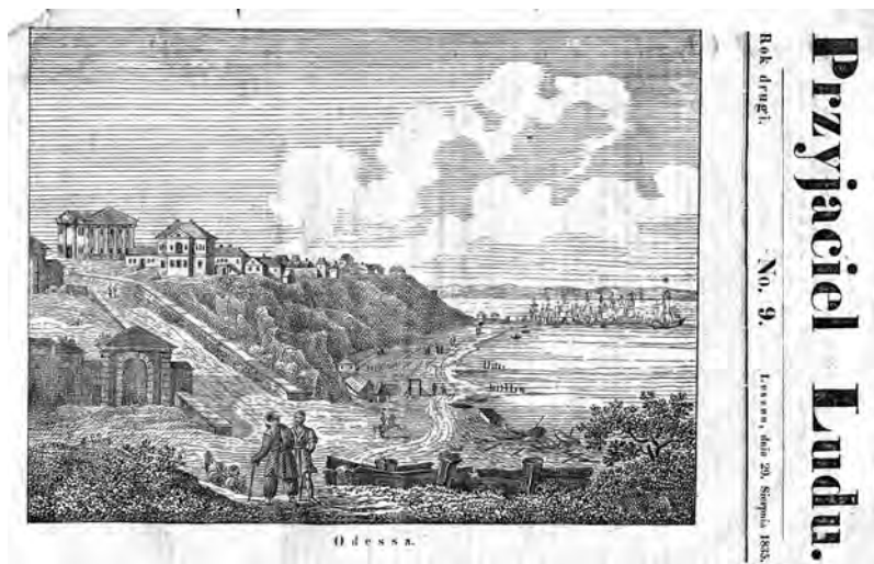
Л. Ф. Кассас. «Одесса». Гравюра. Журнал «Przyjaciel Ludu». 29 августа 1835 г.

Однако вернемся к оригиналу гравюры и отметим, что для ее создания художник Кассас расположился на Карантинном спуске и запечатлел противоположный склон Карантинной балки. Единственное легко узнаваемое здание на вершине Ланжероновского спуска – старый одесский театр, построенный