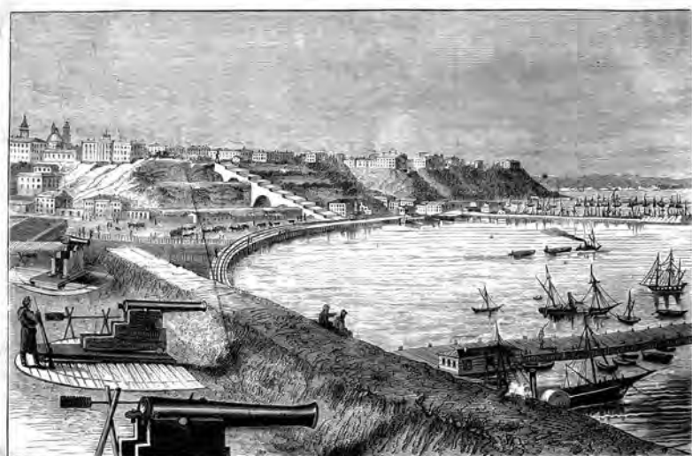
Видъ города Одессы. Съ fotogr. грав. Рошевскій.

И.Г. Рашевский (Рошевский). «Вид города Одессы». Гравюра с фотографии. 1854-1856 гг.