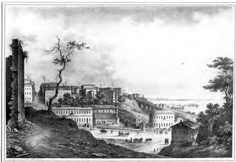
Франц Гросс. «Вид с восточной стороны». Литография. Первая половина 1850-х годов

воды не видно Драгутинской часовни, которую начали строить примерно в 1854 году. Интересно, что гравюра Гросса была нанесена на декоративную тарелку конца XIX века, экспонирующуюся в Одесском литературном музее.