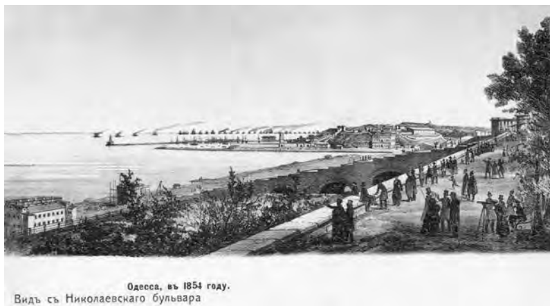
Франц Гросс. «Одесса в 1854 году. Вид с Николаевского бульвара». Открытка с гравюры Издание М. Пиковского. Одесса, 1904 г.

Михаилом Пиковским были изданы открытые письма (открытки) с репродукциями гравюр художника Ф. Гросса, размещенных на «Тиммовском листке». В нашей коллекции есть эти открытки. Чтобы не удаляться от темы статьи, покажем лишь одну из них, копию работы, писанной Францем Гроссом 10 (22) апреля 1854 года на Николаевском (Приморском) бульваре, так как на ней можно различить вдаль, рядом с внушительным зданием портовой таможни, тот самый Карантинный спуск и склон, с разных участков которых писались все приведенные ранее гравюры. Одесская публика на бульваре с интересом, используя бинокли и подзорные трубы, наблюдала за окружением с юго-востока мирного города мощной англо-французской эскадрой, не задумываясь о том, что с невиданных ранее в Одессе огромных по меркам того времени кораблей могут открыться стрельбу по городу.