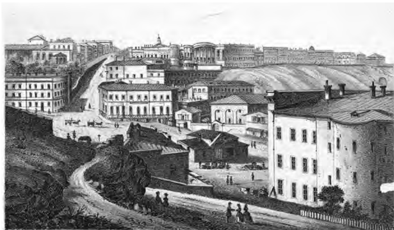
Площадь предъ Таможнею. Platz bei der Tamoschna.

В. Вахренев. «Площадь пред Таможнею». Литография. Одесса, 1869 г.