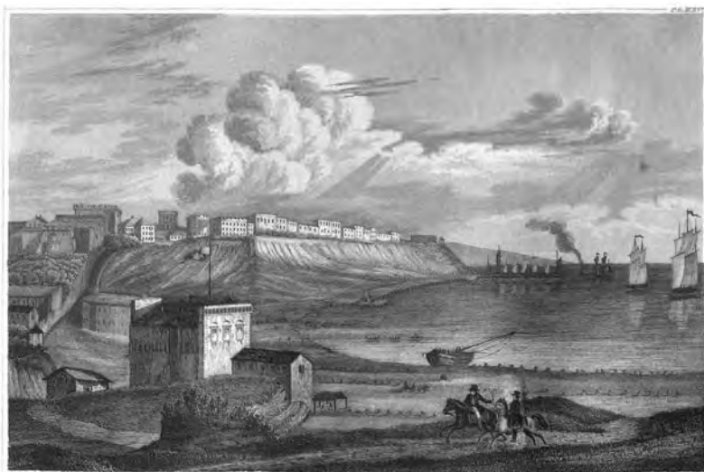
Неизвестный художник. «Одесса». Гравюра. Художественная галерея Библиографического института в Хильдбургхаузене (Aus der Kunstanstalt des Bibliographie Instituts in Hildburghausen) Около 1835 г.

Совсем другой выглядит приморская часть Одессы на гравюре с таким же «оригинальным» названием «Odessa», которая была приобретена нами во время путешествия по Германии. Как видим, перед нами Ланжероновский спуск, на вершине которого красуется первый одесский театр. Все дома на Приморском