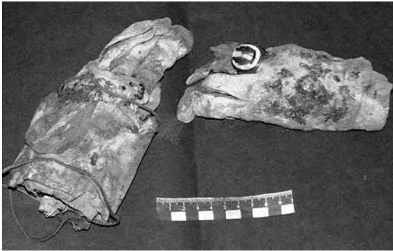
Литургические перчатки с епископским перстнем

На другой фотографии перстень воспроизведен крупным планом. Он сохранился лучше всего, так как не был подвержен коррозии. Это золотой перстень с печаткой из драгоценного двухслойного камня – оникса: белого цвета фон, темно-коричневого – фигуры Святых апостолов Петра и Павла.