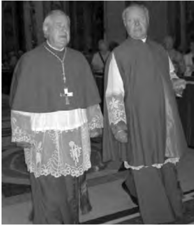
Фотография епископа и священника, облаченных в моцетту (слева) и мантелетту (справа)

изображен епископ, говорит накидка с разрезами вместо рукавов длиной до колен, имеющая название мантелетта (mantolet). Она также служит символом ограничения сферы полномочий, означающим, что перед нами епископ-помощник (главный епископ епархии вместо мантелетты носит короткую накидку моцетта (mozzetta), которая охватывает плечи и застегивается на груди.