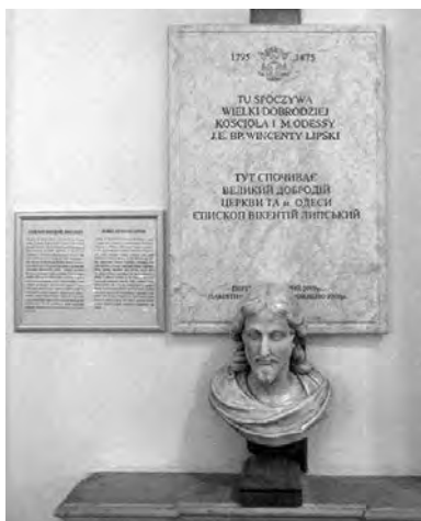
Памятная доска над местом захоронения епископа Викентия Липского в кафедральном соборе Успения Пресвятой Богородицы Девы Марии в г. Одессе

В 1877 в этом храме, в правом пределе был похоронен прелат Г. Разутович. 20 В 1935 году храм закрыли, а в его помещении устроили клуб. После войны здесь находилась спортивная школа. В 1991 году здание возвратили Церкви.