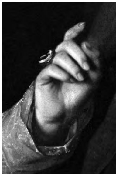
Епископский перстень из погребения и на фрагменте «Портрета священнослужителя»

Эти сведения позволяют сделать вывод, что на портрете священнослужителя Ромуальд Хойнацкий запечатлел епископа Викентия Липского.