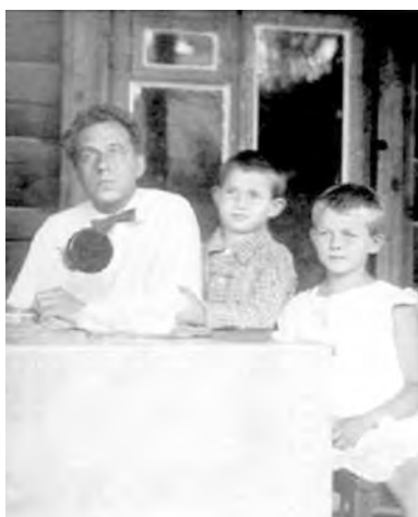
З. Райх и В. Мейерхольд с детьми

тистка, кто-то говорил, что артистка замечательная, кто-то говорил, что все только Мейерхольд, а так бы никогда, и так далее. Но не оценивать одного, что она существенным образом повлияла на Всеволода Эмильевича, и что если бы не она, то, может быть, многие какие-то его шедевры, даже и лучшие моменты в его шедеврах, мы просто бы не знали и не увидели, потому что она его вдохновляла, давала ему какую-то новую энергию, начиная с момента их встречи и в дальнейшем... Поэтому я думаю, что роль этой женщины именно в гении Мейерхольда, в его