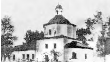
Церковь, где венчались З. Райх и С. Есенин

дочери в Вологду. Это было единственное венчание в бурной короткой жизни поэта.