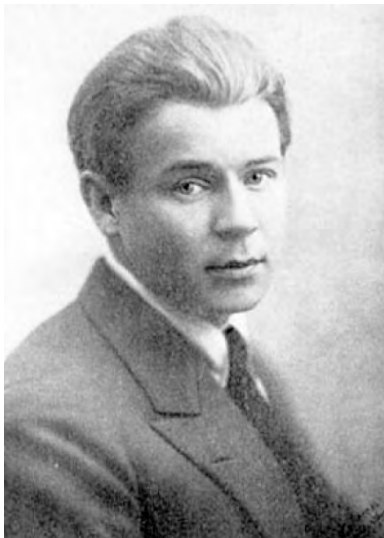
С. А. Есенин в разные годы