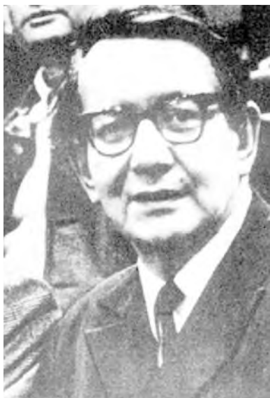
Константин Сергеевич Есенин

надпись – «Всеволод Эмильевич Мейерхольд», хотя захоронение Мейерхольда, скорее всего, существует в братской могиле Донского монастыря. На Ваганьковском кладбище – памятник-кенотаф. Сейчас на нем также высечено имя сына Константина Есенина, похороненного в могиле матери в 1986 г.