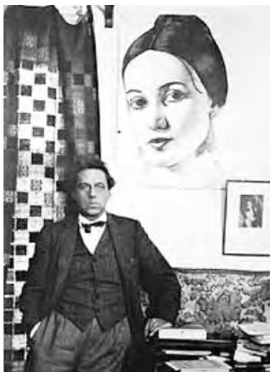
Муж у портрета жены

стройная, высокая, черноглазая и черноволосая, темпераментная, «магнетически привлекательная», с тонкими чертами лица, Райх была яркой и эффектной. А вот другие литературные портреты Зинаиды Райх были далеко не столь восторженными. В «Двенадцати стульях» есть ироничная глава про авангардный «театр Колумба», который возглавляет режиссер Николай Сестрин (на афише – «Ник. Сестрин», подобно «Вс. Мейерхольду») со своей женой «Густой (немецкое имя...), которая никакого отношения к коллективу не имеет». Комментаторы уверены, что про-