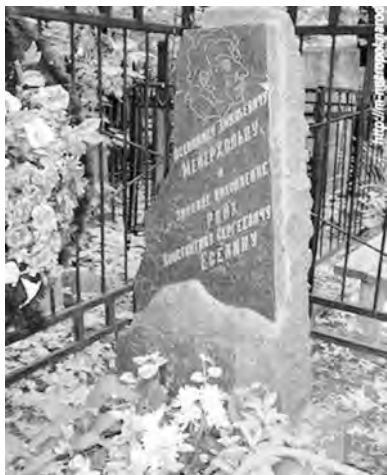
Памятник на Ваганьковском кладбище