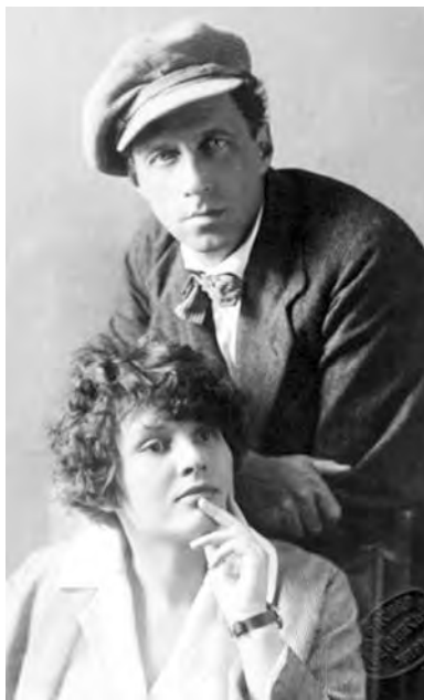
В.Э. Мейерхольд и З.Н. Райх

тонкую, гибкую, с хрустальным голосом, а заодно и Эраста Гарина, не угодившего Зиначке. Гневно ревнивый муж расцветшей героини даже взял ее фамилию в качестве второй и подписывался – Мейерхольд-Райх. Родители перебрались из Орла в Москву, у детей есть все необходимое: лучшие доктора, учителя, дорогие игрушки, отдельные комнаты. Вскоре семья переехала в стометровую квартиру на Новинском бульваре. Зинаида становится одной из первых дам Москвы, она бывает на дипломатических и правительственных приемах, принимает в своем доме самых именитых гостей. Всеволод Эмильевич не только усыновил детей Есенина, но и искренне привязался к ним. И они во всем доверяли отчиму, который неизменно был доволен, когда к детям со двора приходили сверстники (в числе которых бывал и совсем юный Зиновий Гердт).