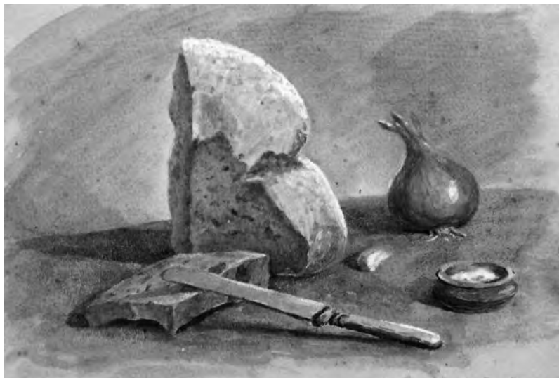
«Хлеб». 1950 г.