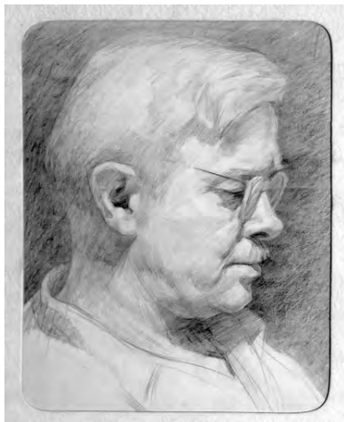
«Портрет отца». 1950-е гг.