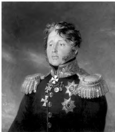
Портрет И.В. Сабанеева. 1826-1827 гг. Джордж Доу и мастерская. Собрание Государственного Эрмитажа, Санкт-Петербург