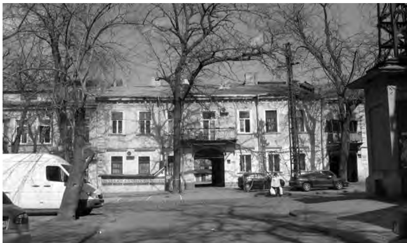
В створе этого двора проходил ликвидированный квартал переулка за вторым отделением Нового рынка. конец 2000-х гг.

Владея столь солидной недвижимостью, Жеваховы, однако, вовсе не были богаты. Известно, что три брата Жеваховы – Иван, Семен и Филипп – совместно унаследовали... 15 душ крепостных, имели лишь офицерское жалованье, всю жизнь провели в походах, Семен и погиб на поле боя в грозном 1812-м году. Так что жили одесские Жеваховы исключительно на пенсион и прибыль от сдачи в аренду недвижимости, в светских тусовках практически не участвовали, благотворительностью занимались без показухи, из градоначальства в последние годы никуда не выезжали. Здоровье израненного князя явно оставляло желать лучшего. Лишившись мужа, а затем и дочери, княгиня оказалась в весьма за-