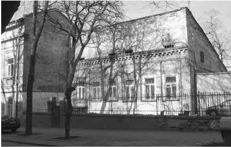
На снимке отчетливо прослеживается прежняя красная линия, на которой находятся архаичные постройки по Княжеской улице

руется архаичными постройками: домами № 38, 36 (эти два дома находятся в пределах первичных дворовых мест 1-го отделения Нового базара), 29, 28, 25, 24 (последний – одноэтажный в три окна и двухэтажный в семь окон по фасаду) и № 11, старинный высокий одноэтажный флигель на цоколе. Сужение в 3-й части нескольких переулков и улиц, даже такой, как Садовая, объясняется многими причинами: не только нарастающим дефицитом мест в центре, но и, как ни парадоксально, стремлением ОСК сократить расходы по мощению и обслуживанию проезжей части.