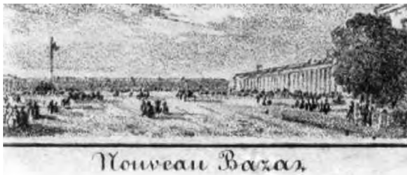
Площадь Нового базара в середине XIX ст.

вич (1754 – после 1817), Александр Яковлевич, Евстафий Теймуразович, Спиридон Эрастович (1768-1815) – также заслуженные российские боевые офицеры и генералы.