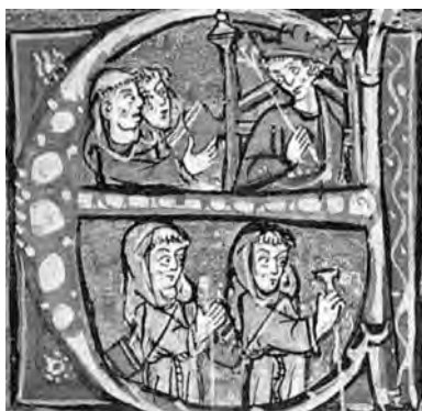
Папа Иннокентий IV отправляет своего посланника Иоанна де Плано Карпини к Великому хану для установления дипломатических отношений

с остатками своей тьмы на юг, к нынешнему одесскому побережью, к озеру, называемому по его имени Хаджибеевским. Очень вероятно, что с тех времен ордынцы начали называть также и башню маяка, имевшуюся в Джинестре, Хаджибеевым маяком. Под этим именем он и упомянут в ярлыке Менгли-Гирея.