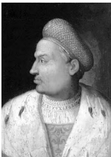
Великий князь Сигизмуд Старый

Очевидцы и их толкователи. В начале июля 1507 г. Крымский хан Менгли I Гирей выдал великому князю Литовскому Сигизмунду I Старому ярлык (ханская льготная грамота. – А. Д.), который содержит перечень населенных пунктов, земель и вод, на управление которыми хан жалует свое соизволение. В их числе указан и некий « городок Ябу », который нигде более не упоминается.