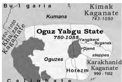
Страна Огуз Ябгу

Это довольно мощное государство долго и успешно воевало с Хазарским каганатом. Так в 985 году огузы-ябу заключили с киевским князем Владимиром военный союз против хазар и поволжских булгар, участвовали в его походе на Хазарию и помогли обложить ее данью. За это впоследствии митрополит Илларион величал