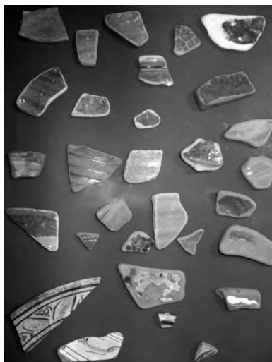
Керамика Хаджибеевой тьмы

Но определяются они порой достаточно отчетливо. Это в большинстве фрагменты красноглиняных мисок, тарелок и кувшинов с желтой, зеленой, бирюзовой и коричневой поливой, часто на ангобной (фр.: engobe – покрытие из жидкой глины) подгрунтовке. Встречены и остатки так называемой кашинной керамики (из смеси песка с известью). Имеются также обломки дорогой светло-серо-зеленой так называемой селадоновой, или псевдоселадоновой, посуды второй половины XIV в., а также осколки расписных глазурованных (так называемых люстровых ) сосудов иранского производства того же времени.