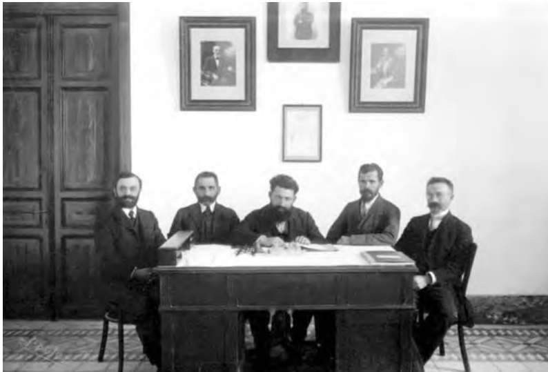
Администрация гимназии. 1910 г.

летворить всех: назовем поселение Тель-Авив – «Холм весны». Это название упоминается в Танахе, в книге Иехезкеля, и оно связано с именем Беньямина Зеева Герцля, потому что его книга «Альтнойланд» переведена на иврит Нахумом Соколовым под названием «Тель Авив». За предложение назвать будущий город Тель-Авивом проголосовало большинство из 800 жителей Ахузат-Байта.