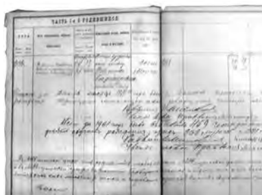
Книга раввината по г. Балте. Подпись Менахема Шейнкина.