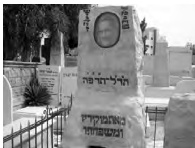
Могилы М. Шейнкена. Фото из фондов Национальной библиотеки Израиля