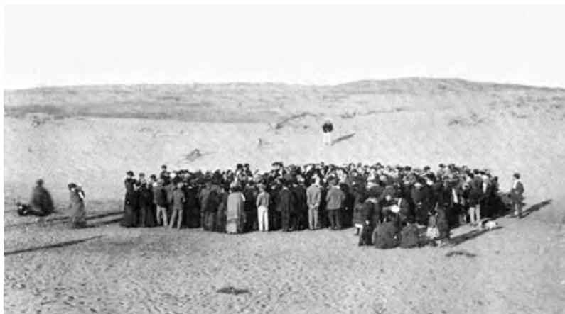
Еврейское поселение Ахузат-Байт.

сионистов в США для сбора средств он погибает в дорожной аварии в Чикаго.