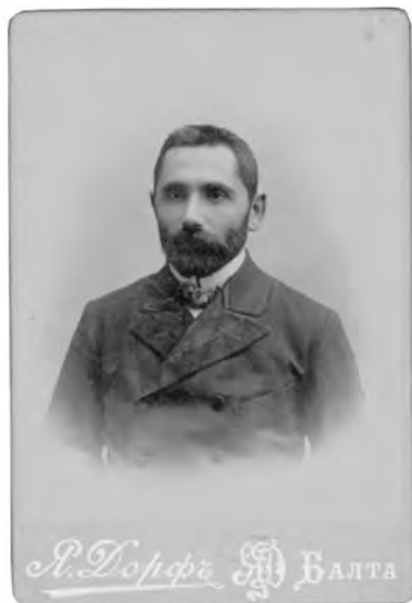
Менахем Шейнкин.

21 мая 1910 года на собрании общины Менахем Шейнкин предложил переименовать район Ахузат-Байт в Тель-Авив: «У меня есть предложение, которое, на мой взгляд, может удов-