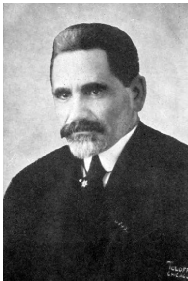
Менахем Шейнкин.

С Б-жьей помощью эти старые чугунные столбы с надписями на иврите будут установлены в здании Савранской синагоги. Они будут символизировать связь Главной синагоги Балты, где в начале XX века казенным раввином служил Менахем Шейнкин, и восстанавливаемой Савранской синагогой.