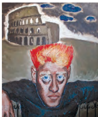
Портрет Феликса Кохрихта