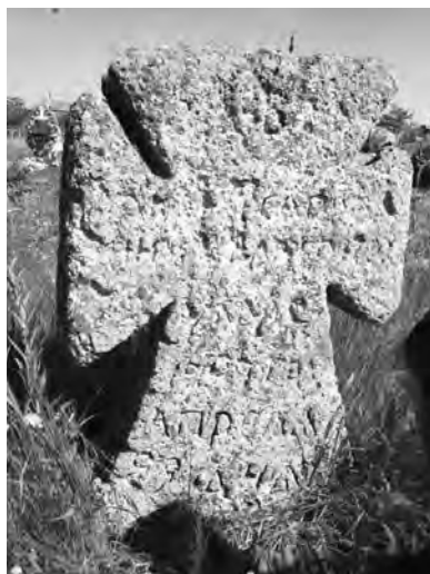
Старинные надмогильные кресты мальтийского типа на кладбище села Коблево. Снимки Натальи Евстратовой, май 2018 г.

который в ту пору ближе подступал к селу, занимая нынешние низины. Сейчас церковь расположена примерно в 250 метрах по прямой от трассы, однако по старым картам отчетливо видно, что в первой половине позапрошлого века почтовый тракт пролегал правее, поскольку физически не мог проходить по затопленным низинам. Ландшафт антропогенно изменен, геоморфология теперь несколько иная.