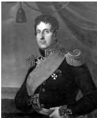
Портрет Фомы (Томаса) Александровича Кобле. Художник Карл Рейхель, 1819 г. Из собрания Одесского художественного музея

Он же получил участок под домостроения в числе самых первых одесситов в августе-сентябре 1794 года непосредственно из рук первостроителей города, де Рибаса и де Волана. Когда-то ему принадлежал обширный комплекс зданий и сооружений с большим садом, ограниченный современными улицами Дворянской, Коблевской, Торговой и Садовой. Впоследствии эта территория постепенно раздробилась на фрагменты, перешедшие в собственность разным лицам.