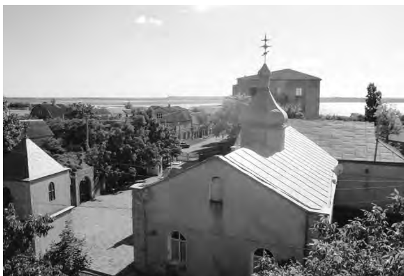
Троицкая церковь в селе Коблево. май 2018 г.