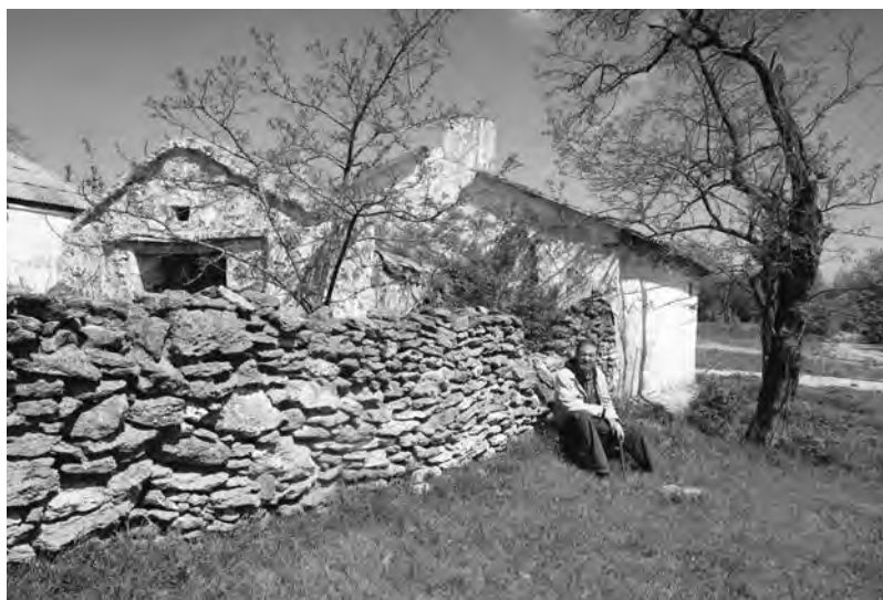
Архаичные постройки в Анатольевке. Снимки Натальи Евстратовой, 2018 г.