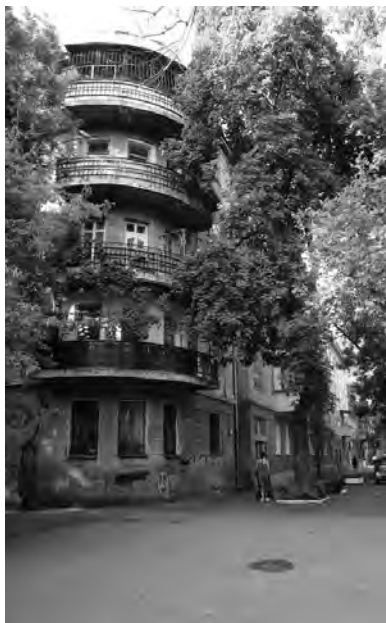
Дома Кoble (не сохранились) занимали весь квартал от этого угла, Дворянская, № 16, до Садовой улицы. В их тылу был сад, протягивавшийся до нынешней Торговой улицы, по которой находились принадлежавшие Фоме Александровичу торговые лавки. 2019 г.

отчетливо видно, что Кoble фактически застроил лишь места вдоль Дворянской и Торговой улиц, а все остальные участки, № 220-229, были заняты садом. Однако никто, и, прежде всего, ОСК, не предъявлял к нему никаких претензий. То есть Кoble был на особом положении.