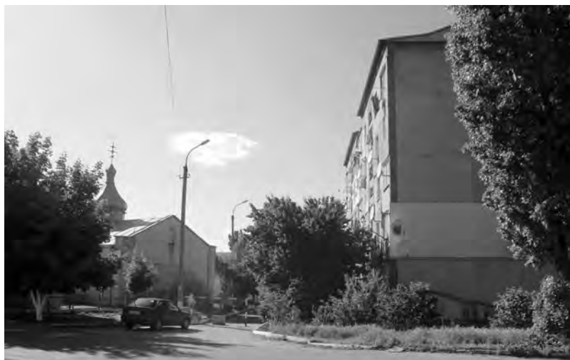
Место цвинтаря за Троицкой церковью, где, очевидно, были погребены Кобле, его супруга, дочь и сын. май 2018 г.