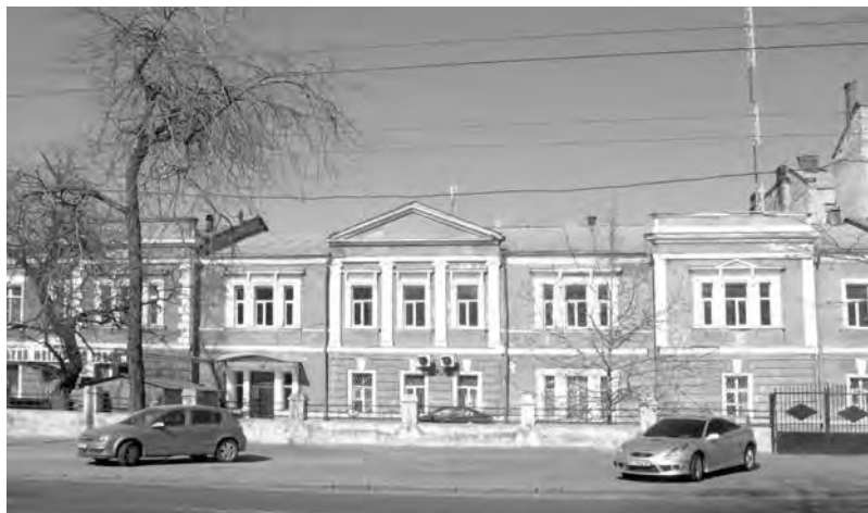
Вид на бывший дом Софии Потоцкой со стороны улицы Конной. Снимок автора начала 2010-х гг.

На протяжении ряда лет София Потоцкая периодически жила в Одессе, вплоть до 1820-го: в это время она выясняла территориальные отношения с одним из соседей по другому принадлежавшему