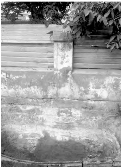
Большая часть каменного забора перед бывшим особняком Софии Потоцкой давно находится под землей в результате значительных отсыпок грунта по ходу нивелирования Софиевской улицы и устройства Нарышкинского спуска.

Параллельное наличие в течение ряда лет двух смежных домов Потоцкого часто приводит к путанице. Даже в таком довольно серьезном издании, как «Одесская старина» (1869), значится, что дом № 1 перешел от графа А. Потоцкого (снова путают Александра и Болеслава) напрямик к Маразли, а дом № 2 – от Льва Нарышкина к князю Голицыну.