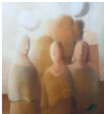
Работы из коллекции Семена Верника