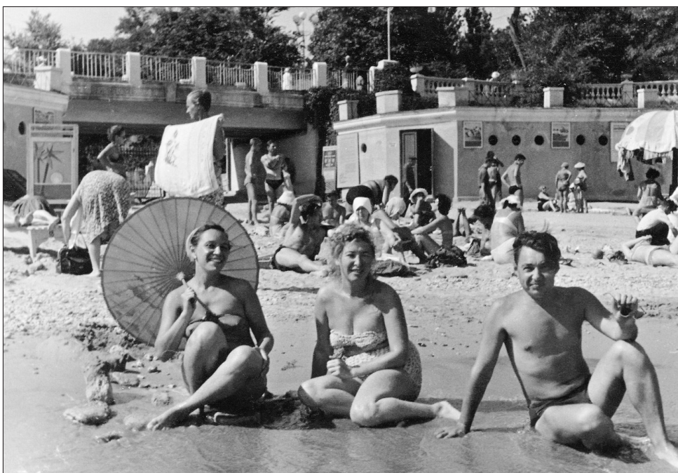
На пляже в Аркадии. 1960 г.