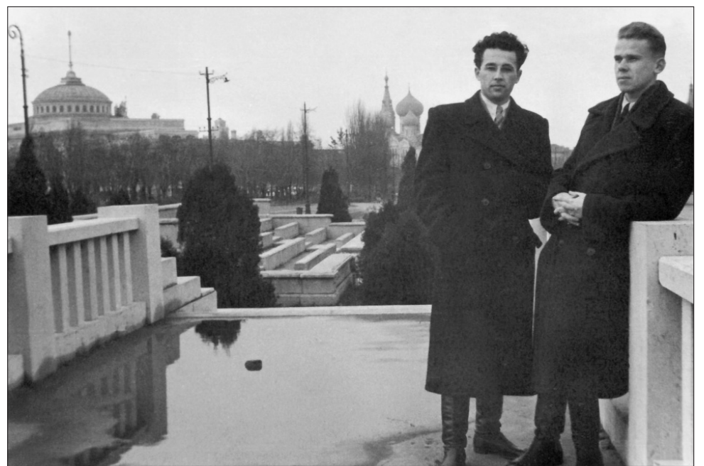
На трибунах на площади им. Октябрьской революции. Начало 1950-х гг.