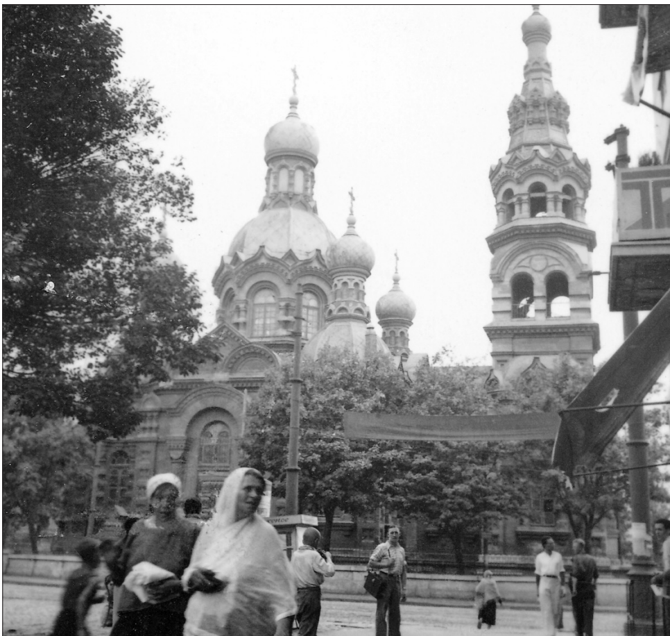
Вознесенская (Мещанская) церковь со стороны ул. 1905 года (Тираспольской). Фото 1930-х гг.