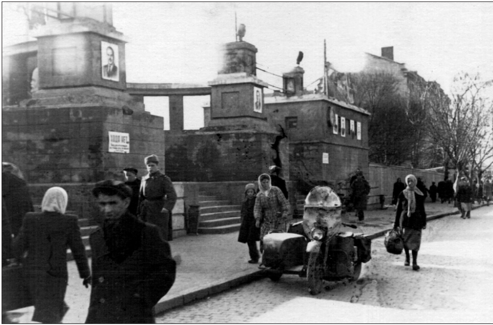
Временный выход на перрон Одесского вокзала после разрушения старого в 1944 г. и постройки нового.