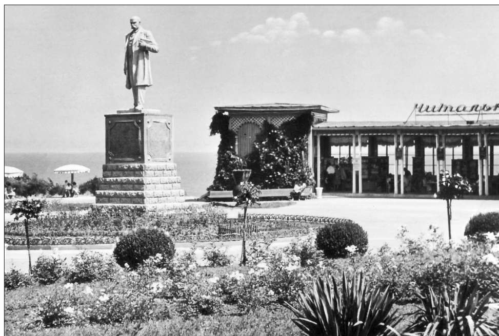
Памятник Т. Шевченко, стоявший перед "Читальней" и шахматным клубом. 1962 г.