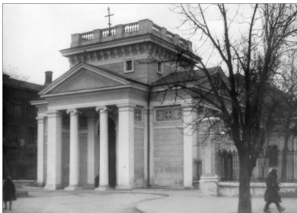
Греческая Свято-Троицкая церковь после разрушения купола и колокольни. 1960-е гг.