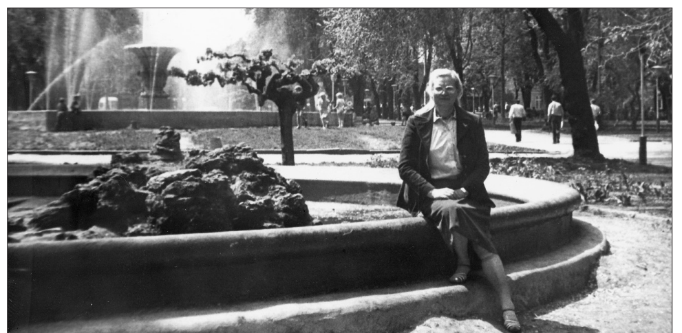
Фонтаны на площади Советской Армии. Конец 1980-х гг.