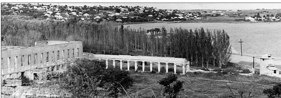
Развалины Крестьянского санатория. 1976 г.