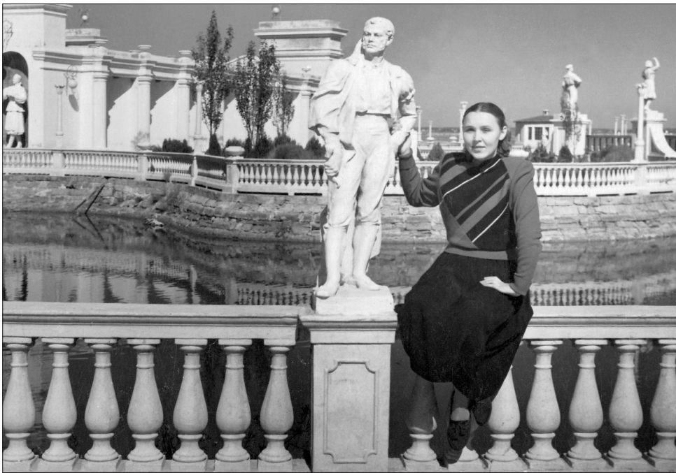
Летний театр Куяльницкого курорта. 1956 г.