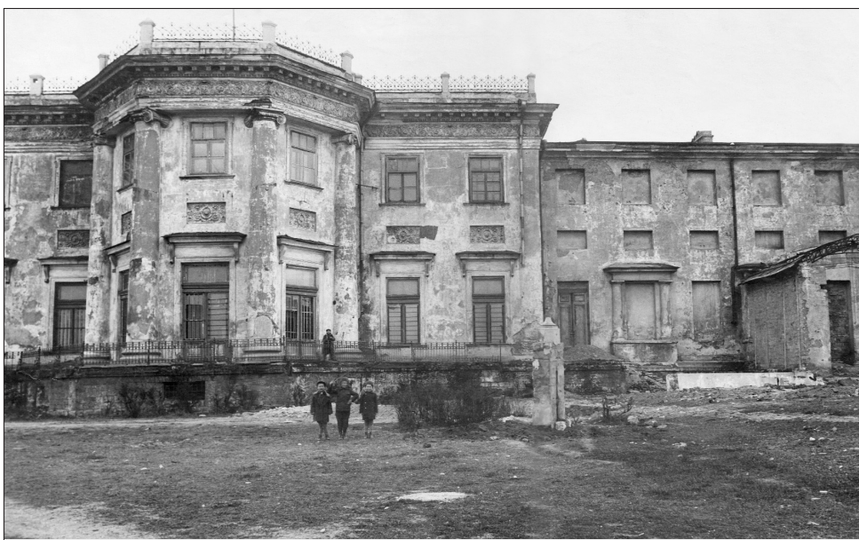
Орловский корпус Воронцовского дворца. Фотография 1920-х гг.