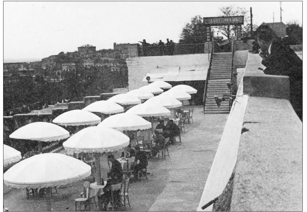
Кафе "Маяк" на нижней террасе бульвара. 1950-е гг.