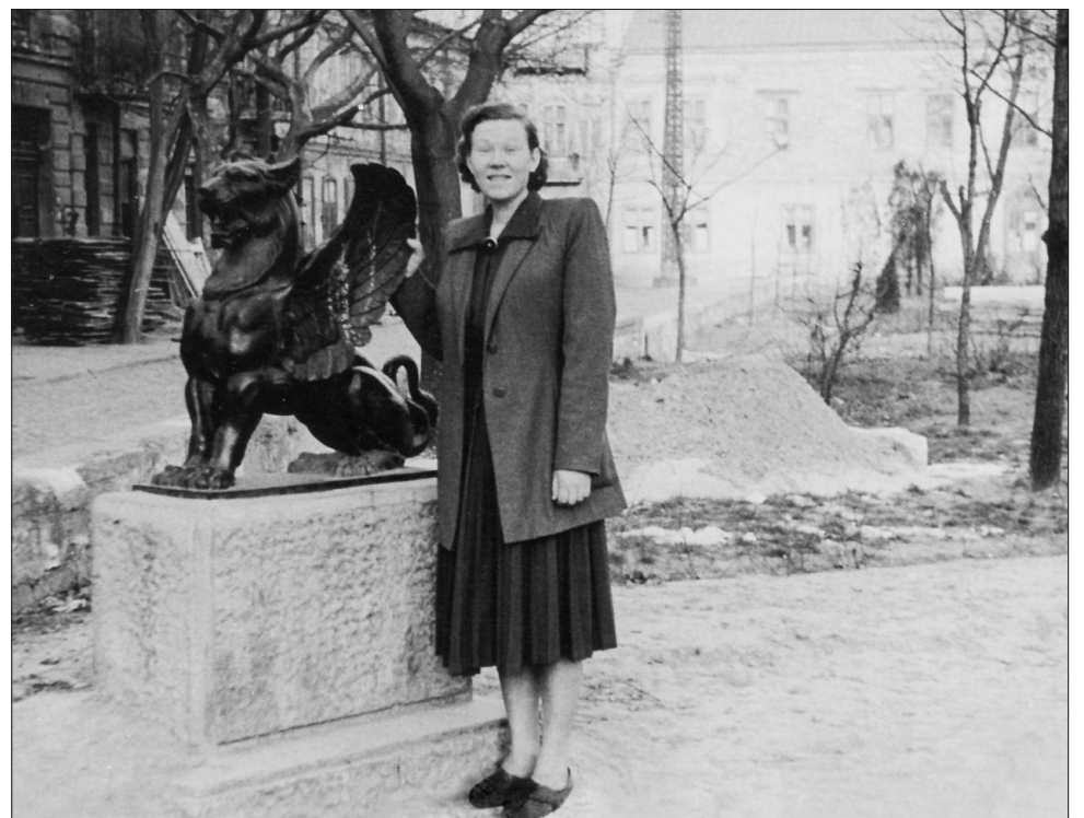
Грифон в сквере им. Кирова. 1957 г.