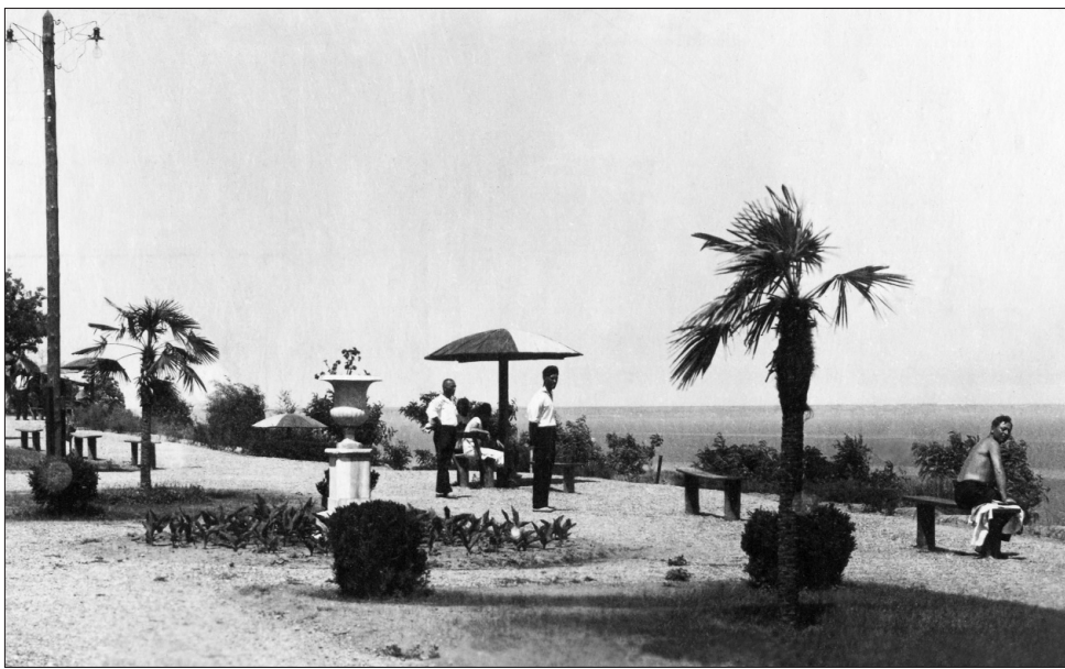
Приморская аллея Лермонтовского курорта. 1935 г.