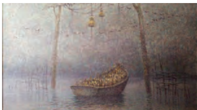
Работы Эдуарда Пороника