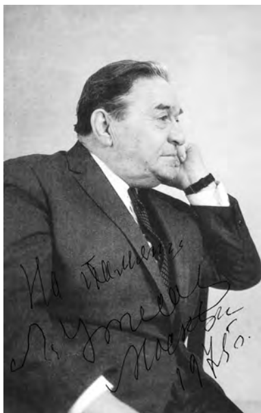
Тот самый автограф Леонида Утесова.