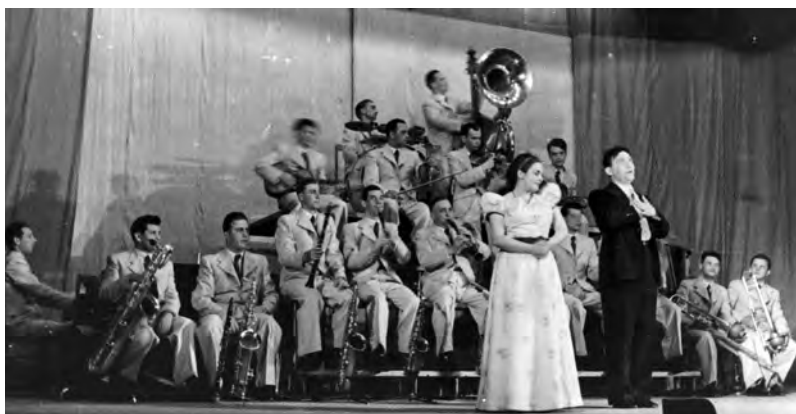
Оркестр Леонида Утесова в 1946 году

Интересно, что сегодня мало кто помнит о выступлениях Утесова в Эстонии. Даже его биографы до недавнего времени не знали о них. Я не сомневался в том, что такие концерты были, их не могло не быть! Благодаря помощи историка культуры Лооне Отса, доктора философии, удалось разыскать не просто упоминания, но рассказы от первого лица о концертах Государственного джаз-оркестра РСФСР. Вот фрагмент из интервью Утесова культурному еженедельнику «Серп и молот» 23 марта 1946 г.: