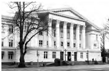
Дом офицеров флота в Таллине