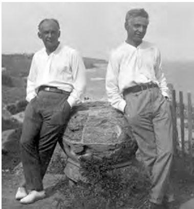
Вадим Меллер (слева) и Лесь Курбас