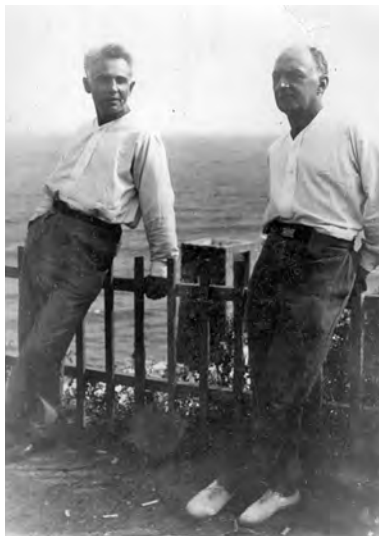
Лесь Курбас и Вадим Меллер. Одесса, 1928 г.