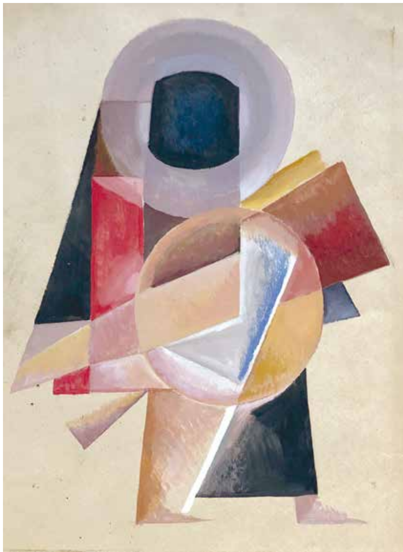
Эскиз из моей коллекции