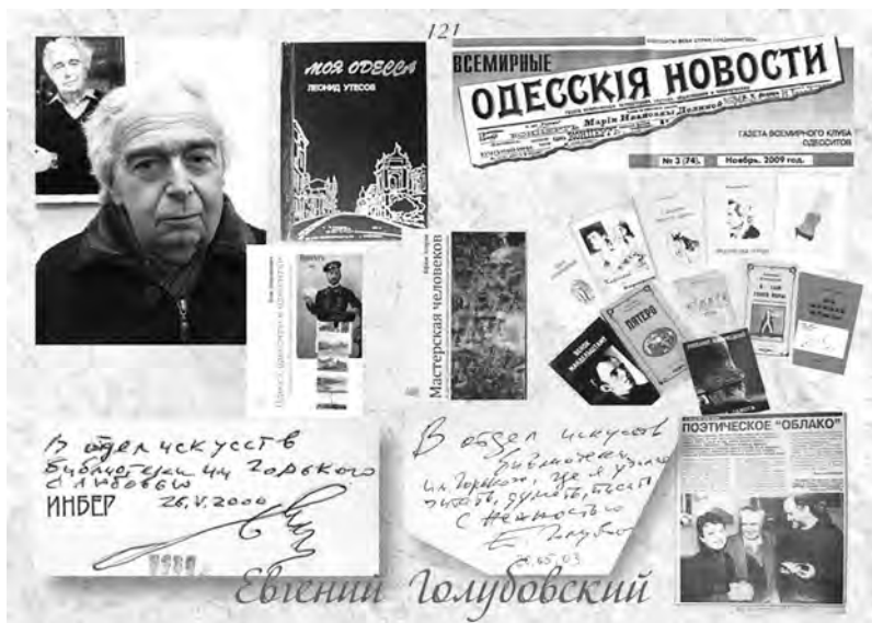
Страница из альбома «С искренней благодарностью...». 2014 г.

поэтические сборники 1910-х годов. Две подаренные им из своего собрания книжечки, так же, как и его собственные, стоят у меня на полках, и всегда будут напоминать о добром удивительном талантливом человеке.