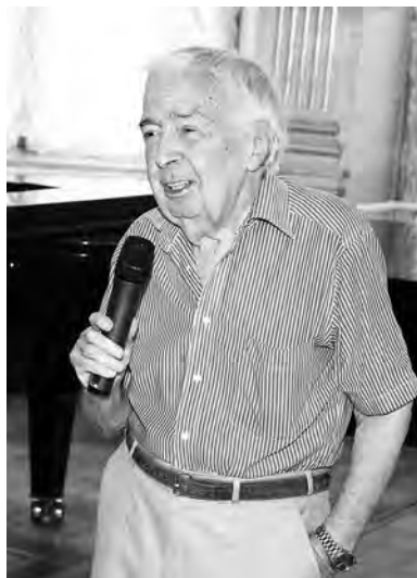
На книжной презентации в ОННБ. 2017 г.

Удачной оказалась идея собрать и издать еще одно сувенирное издание – «Одесский журнал «Крокодил» и его ав-